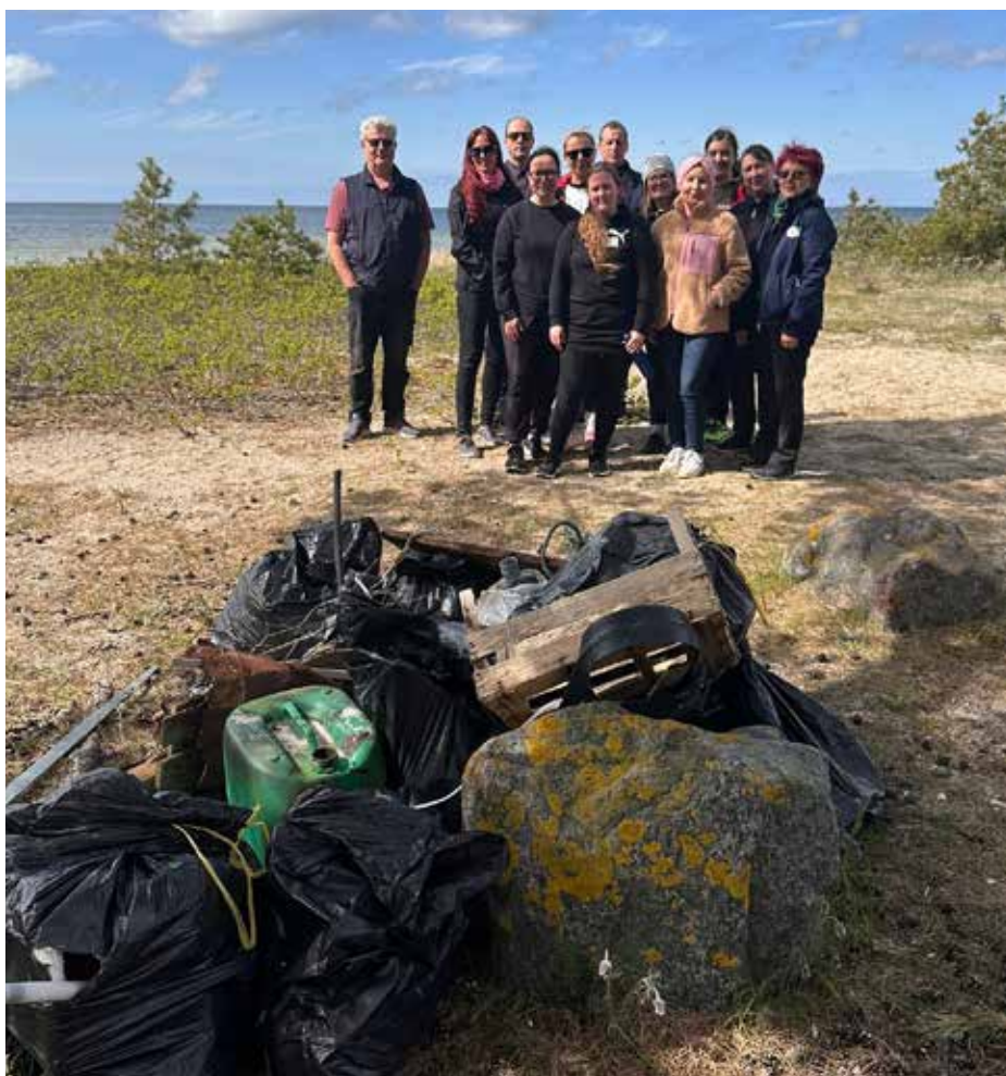
Lääne-Harju vallavalitsus korraldab oma meeskonnaga talguid tavapäraselt mitu korda aastas, nende hulgas ka rannikutalguid

Sageli piisab kahest-kolmest inimesest, et tekiks suurem liikumine. Ka Lääne-Harju vald näitab, et aktiivsed piirkonnad kuju-