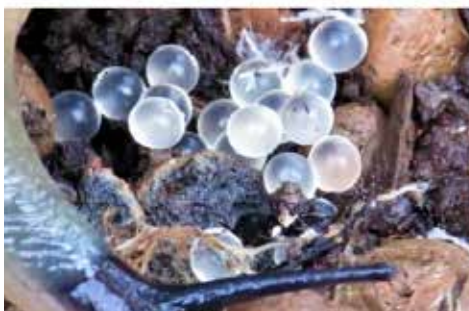
Mustpeanälkjas ja tema munad. Mustpeanälkjas ei sarnane ühegi meie kodumaise teoliigiga

hoida umbes kaks kuni kolm nädalat karantiinis. Aiatehnikat laenutades tasub see enne kasutust hoolikalt puhastada.