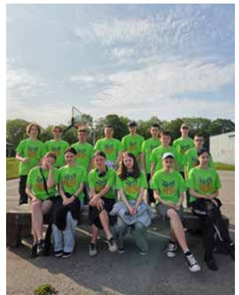
Noored malevas

Tööga sisustatud hommikutele järgnevad mitmekesised vaba aja tegevused, mis