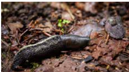
Must seatigu on kodumaine teoliik. Tunned kasuliku liitlase ära sõrmejälje mustri järgi mantlikilbil

H ispaania teetigu ja mustpeanälkjas on Eestis laialt levinud võõrliigid, kes on kohastunud meil talve üle elama eelkõige munadena, hispaania teetigu lisaks ka noorte isenditena. Munad on neil paigutatud väikeste kogumitena lehekõdu alla, kompostihunnikutesse ning mujale varjulistesse ja niisketes kohtadesse. Heades varjekohtades lumikatte all püsis ka külmal talvapäeval temperatuur teole soodsalt nullilähedane.