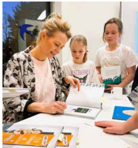
Lodijärve Kooli lugemisöö