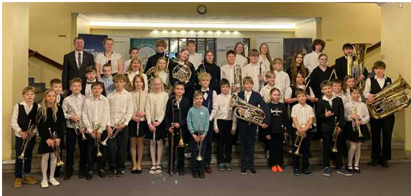
Lääne Harju noortepuhkpilliorkester peale esinemist Eesti puhkpilliorkestrite turniiril 2026