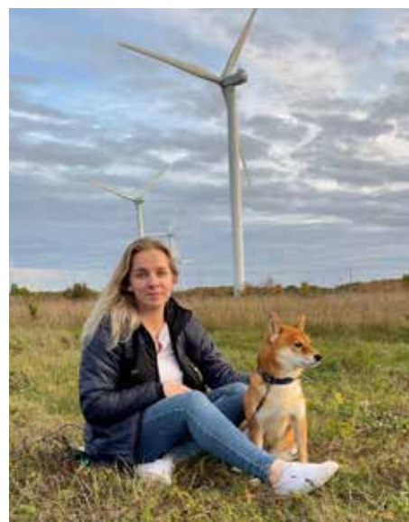
Геттер и ее четвероногий друг Тофу любят совершать долгие прогулки по окрестностям Палдиски.

«Моя повседневная работа заключается в расследовании различных несчастных случаев и ущербов, что требует ясной головы, а зачастую и умения справляться со стрессом. Чтобы не перегореть, я считаю, что в определенные моменты важно отключиться от работы и отправиться на прогулку в лес или к морю. Когда я начала подбирать себе дом, близость моря и природных троп