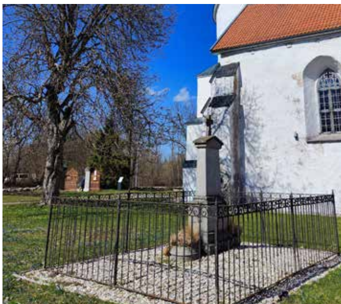
Памятник погибшим в Освободительной войне в Ристи, Юрьев день 2023 г.