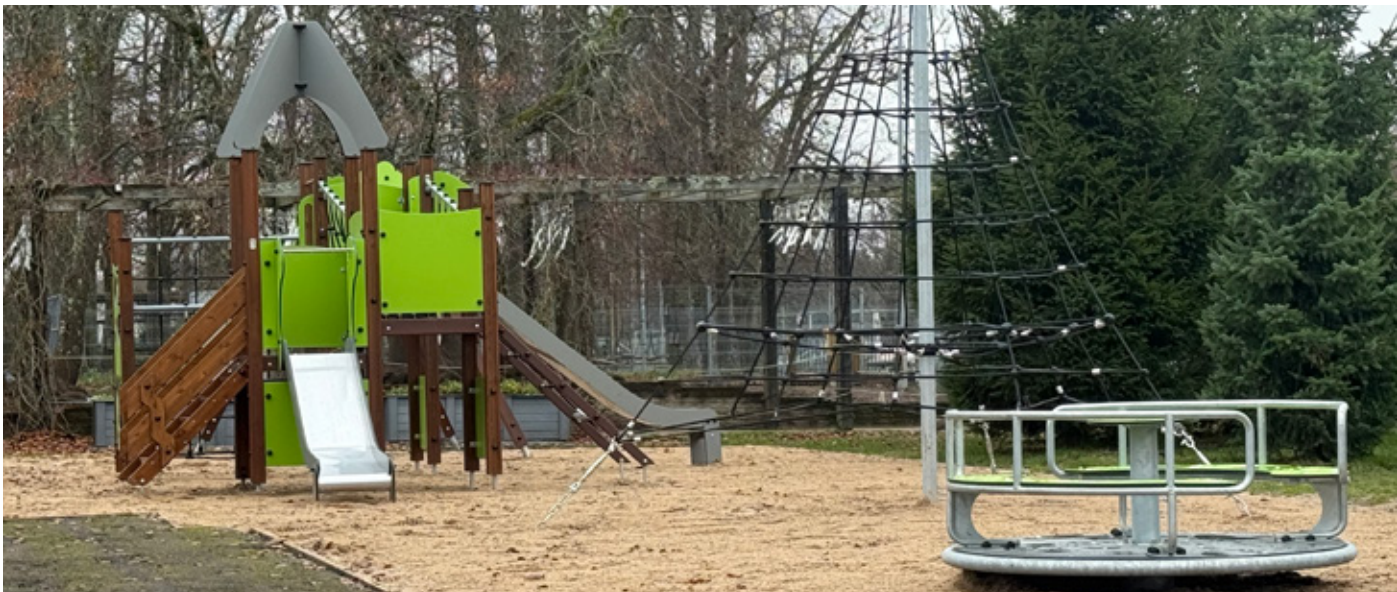
Taolise mänguväljaku ehitamiseks on vaja ligikaudu 15 inimese aastast tulumaksulaekumist.

DETSEMBER 2025 | NR 10 (86) | WWW.LAANEHARJU.EE | LAANEHARJUVALD