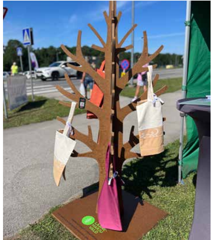
Lääne-Harju valla kotipuu Laulasmaa laadal