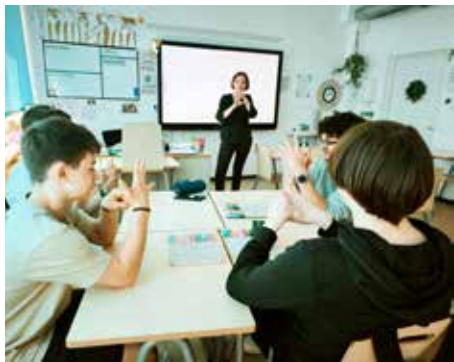
Laulasmaa Kooli 8. klassi õpilased praktiseerivad inimeseõpetuse tunnis hingamisharjutust