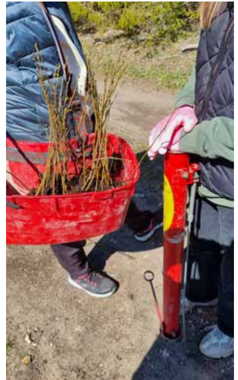
Vasalemma kooli lapsed istutasid metsa

Kui istutustööd tehtud, panime üles lindude pesakasti. Saime teada, kuidas valida pesakastile õige koht ja miks paigaldatakse pesakasti lennuava ümber rauast plaat. Kas teie teate miks? Aga sellepärast, et mõni suurem lind ei saaks pesakasti lennuava suu-