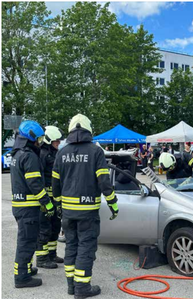
Maakaitsepäeval demontseeriti kuidas väljuda avariilisest sõidukist