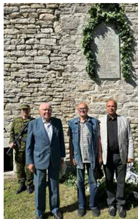
Mälestustahvel 17-le Harju-Madise ja Harju-Risti kihelkonna mehele, kes Vabadussõjas võideldes kaotasid oma elu