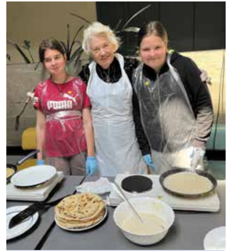
Vasalemma Rahvuste Selts