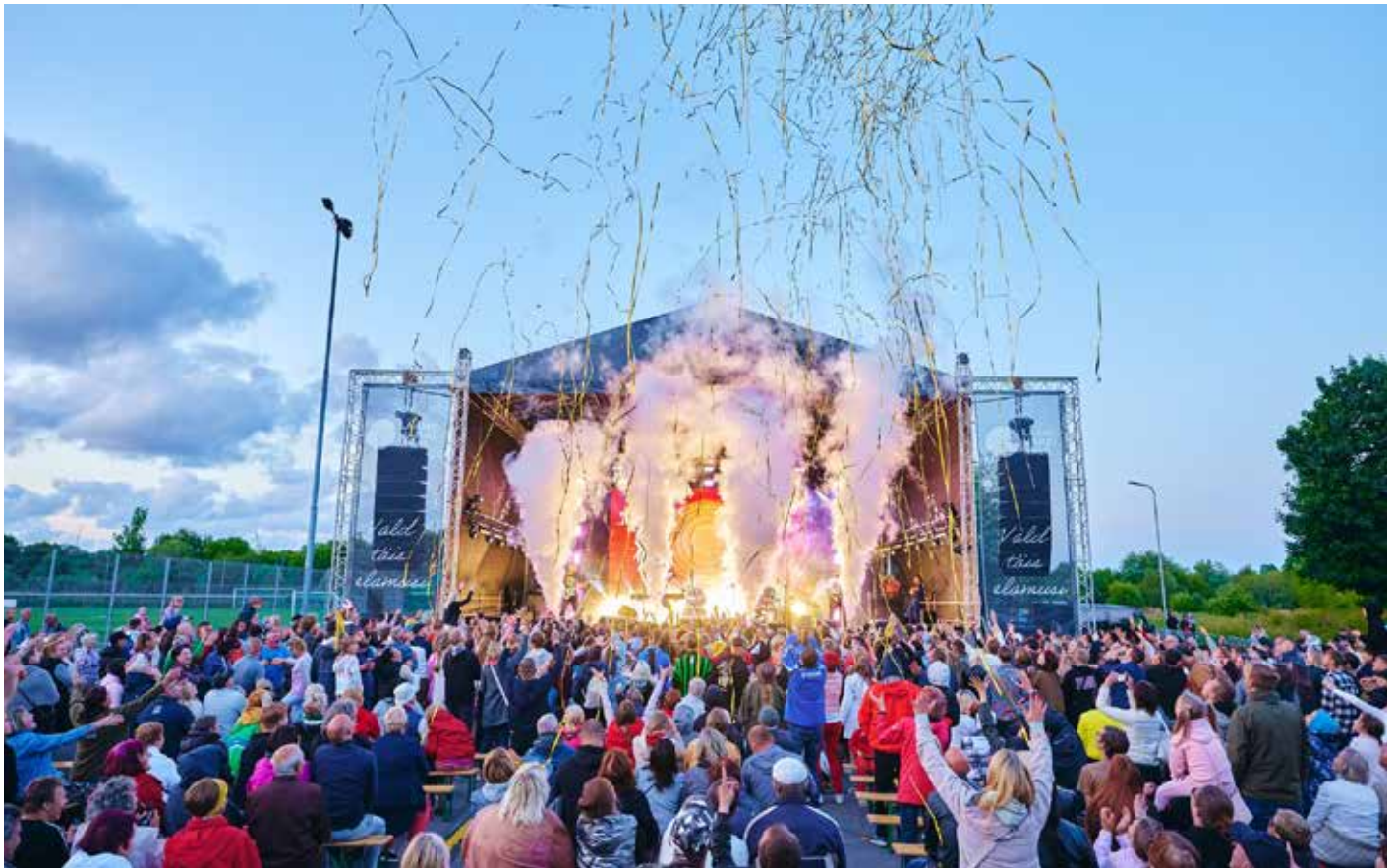
Elmisel aastal oli Paldiskis kohal väga suur hulk inimesi, tule vaata kuidas on lood sel aastal