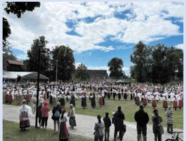
Tantsupeo osa Haapsalu Piiskoplinnuses