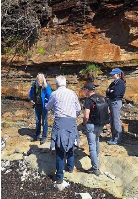
Seminari väljasõit Pakri poolsaarel